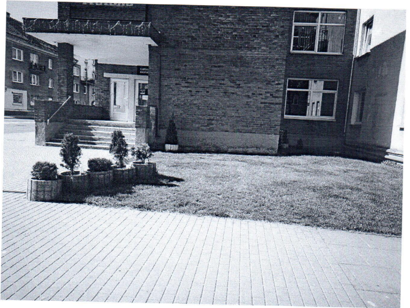
Minijos g. 141a